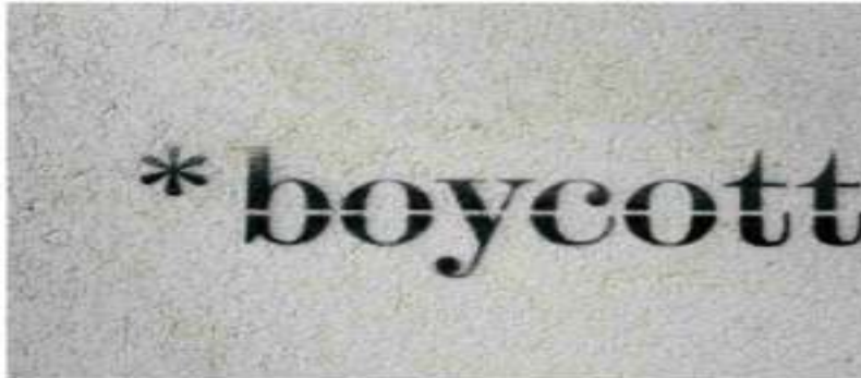
Representational image. File photo.

The Dalits say the upper castes on June 7 razed the tank's brick pump house, poured diesel into the tank to kill the fish, and have since been ostracising