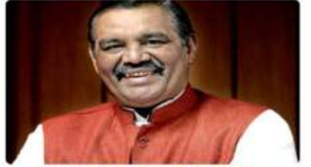
SHRI VIJAY SAMPLA CHAIRMAN

National Commission for Scheduled Castes