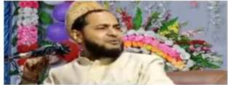
A cleric gave a sermon in Jammu, June 15, 2022, addressing a group of people.

The National Commission for Scheduled Castes has issued a notice to UP government officials over an Islamic cleric's casteist slur against women.