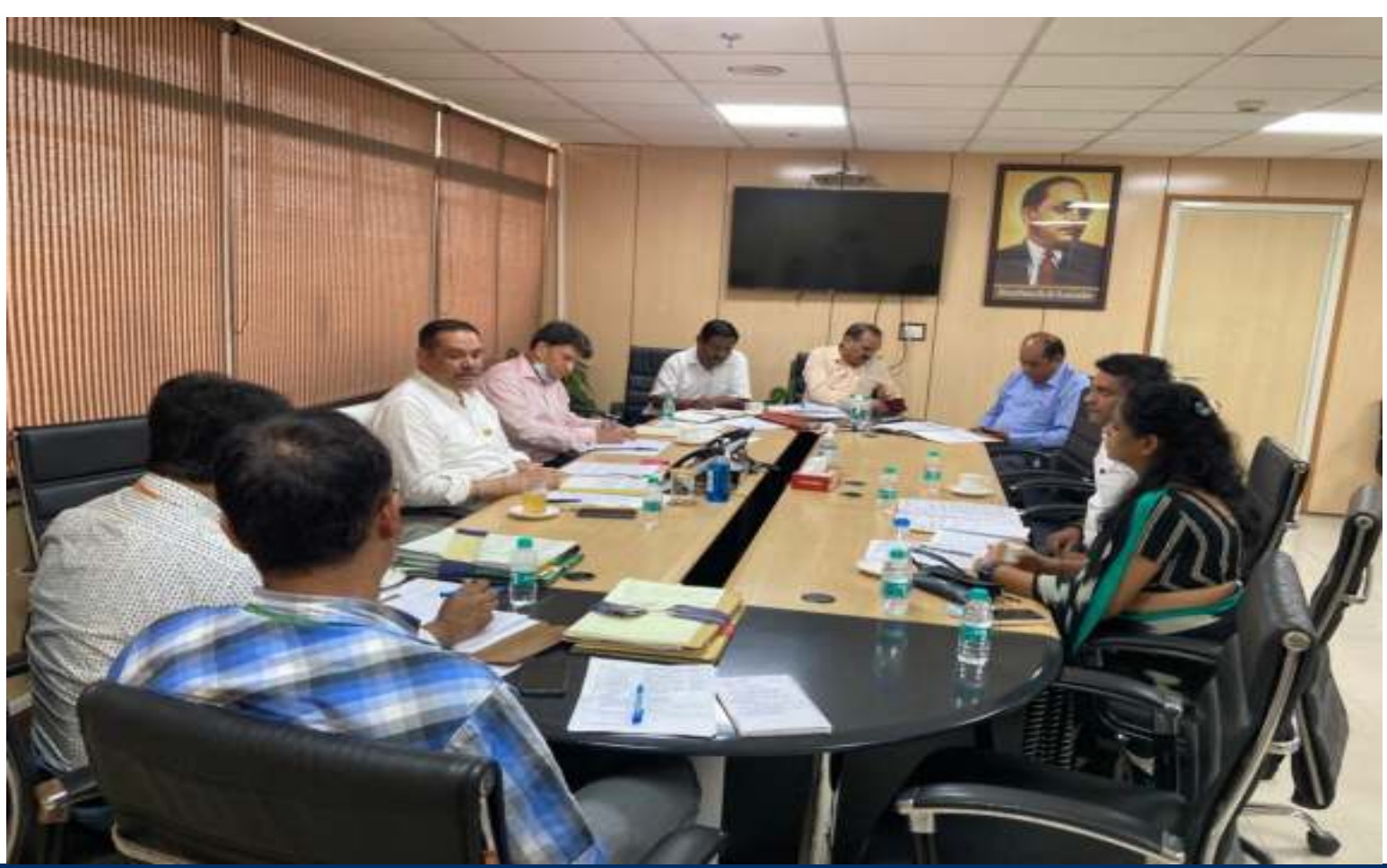
आयोग के नई दिल्ली कार्यालय में विभिन्न जनपदों से आये हुए व्यक्तियों की शिकायतें सुनते माननीय अध्यक्ष श्री विजय सांपला जी।