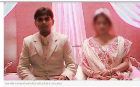
समीर वानखेड़े के परिवार के सदस्यों के साथ समीर वानखेड़े की तस्वीरें

सुशासन के सर्वोच्च निकाय सीजेडी के अध्यक्ष एन सीबी के डायरेक्टर समीर वानखेड़े ने सोमवार को अनुसूचित जाति आयोग को अपने सभी दस्तावेज सौंप दिए, उन्होंने बताया कि दस्तावेज की जांच के बाद आयोग अपनी रिपोर्ट देगा.